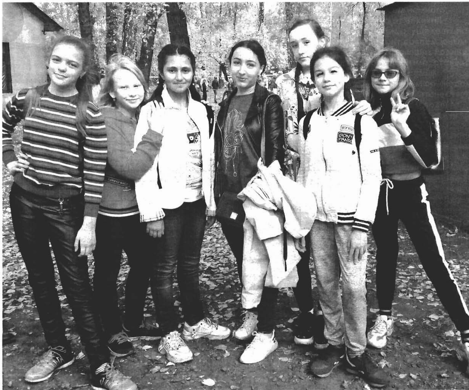
На субботнике вместе с классом.