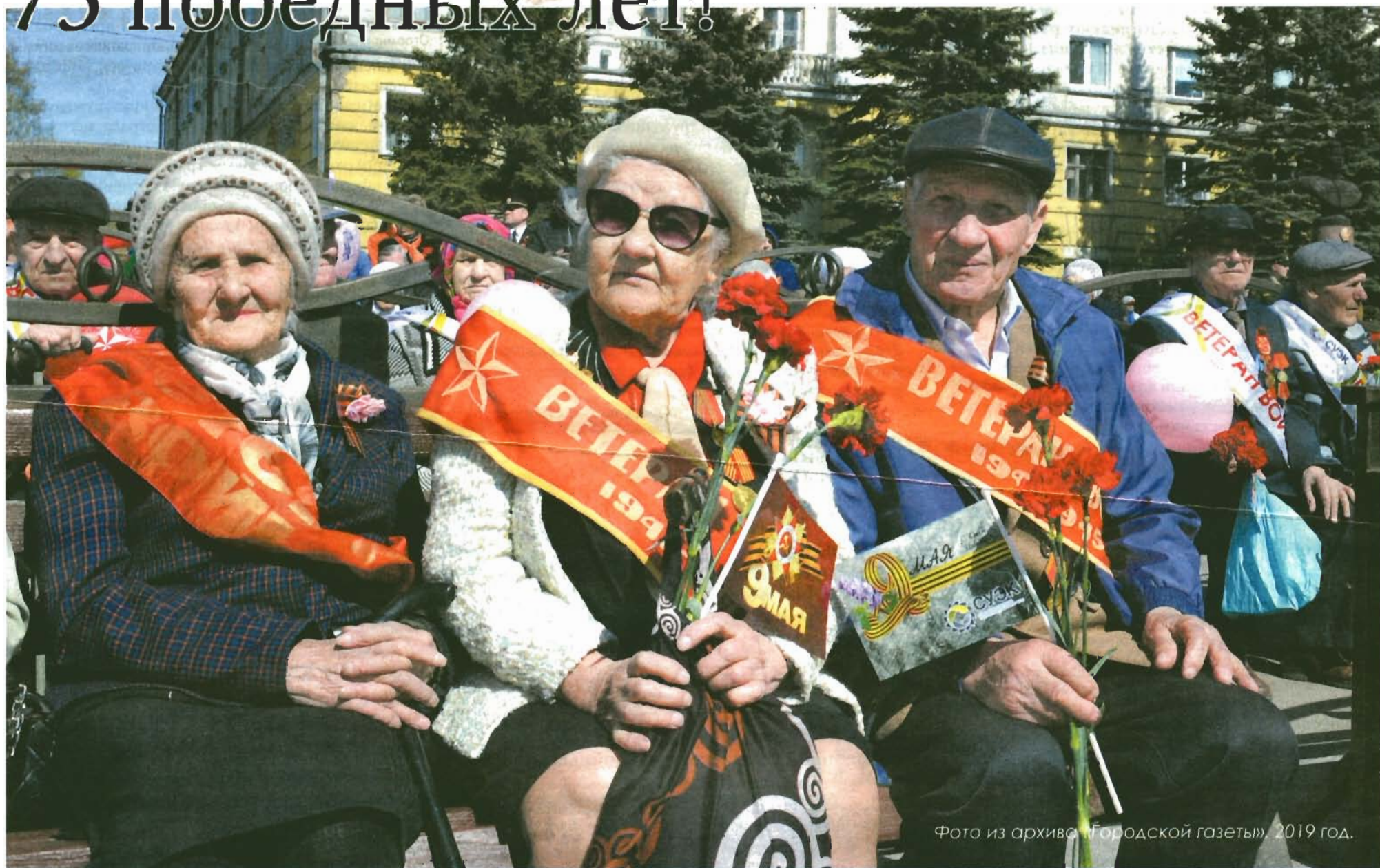
Фото из архива «Городской газеты», 2019 год.

Ветераны Великой Отечественной войны - наша слава и гордость, пример для всех поколений наследников Великой Победы.