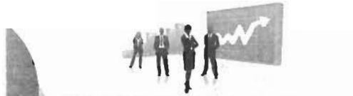
Поддержка малого и среднего предпринимательства

К сведению субъектов малого и среднего предпринимательства! Отдел потребительского рынка и развития предпринимательства информирует о мерах поддержки субъектов малого и среднего предпринимательства в период пандемии коронавируса (COVID-19).