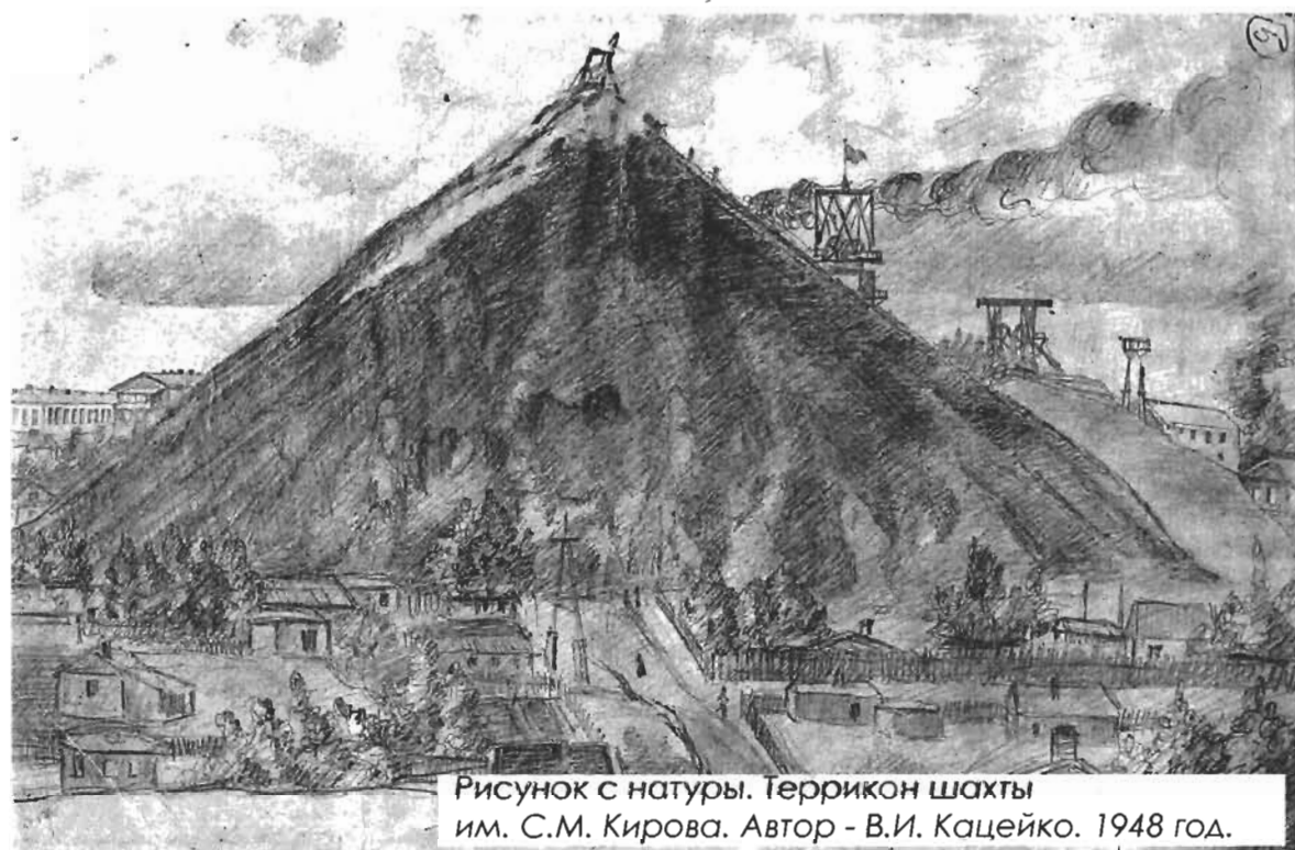
Рисунок с натуры. Террикон шахты им. С.М. Кирова. Автор - В.И. Кацейко. 1948 год.