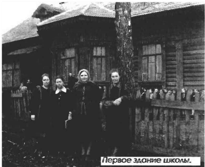
Первое здание школы.

Учитель английского языка МБОУ «ООШ №73», руководитель школьного музея.