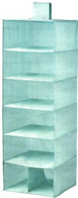
1 место - модуль для хранения / 7 отделений «STUK».