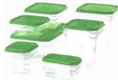
3 место - Набор контейнеров / 17 шт. «PRUTA».