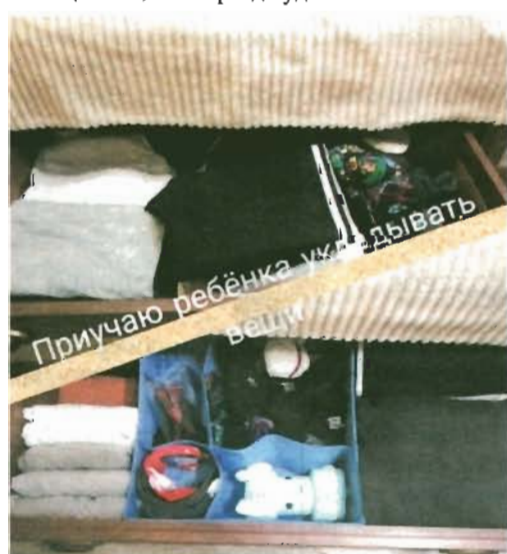
Порядковый номер - 5.