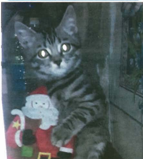
«Муся: «Вот сейчас куранты пробьют и побегу за подарками!».

Уважаемые читатели, мы продолжаем конкурс на лучшее фото вашего питомца. Но в этот раз с одним нюансом – на фотографии с вашим любимцем обязательно должен быть любой новогодний атрибут: елочная игрушка, мишура или что-то еще из мира новогодней сказки. • Условия участия в конкурсе - присылайте фотографии хорошего качества по электронной почте: Gorodgaz@yandex.ru , с пометкой «Новогодние ЛапУшки». • Продлим новогоднее настроение до середины января, ведь именно столько времени продлится наш конкурс! Участвуйте и выигрывайте!