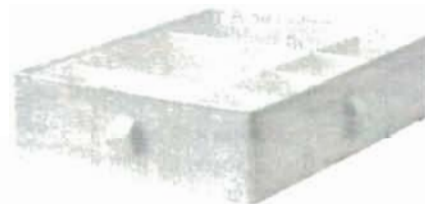
2 место - ящик с отделениями «SKUBB».