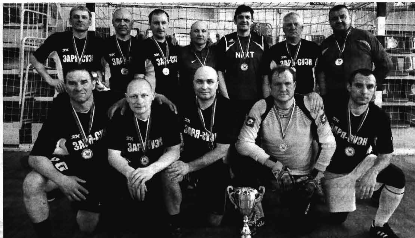
Команда ветеранов «СУЭК-Кузбасс».