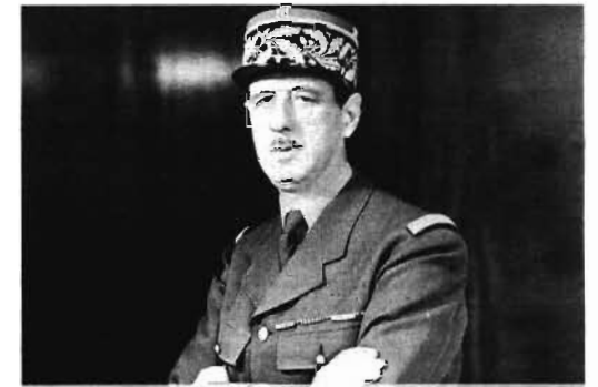
Шарль де Голль.