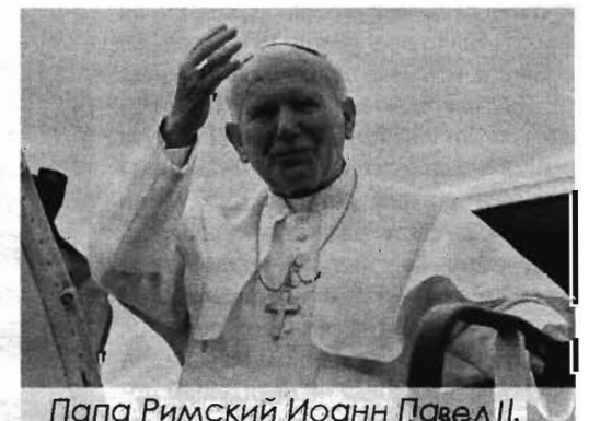
Папа Римский Иоанн Павел II.