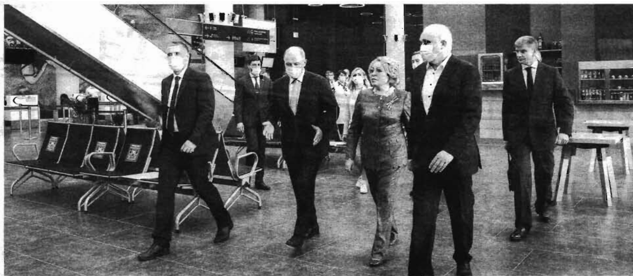
Посещение нового терминала аэропорта им. А. Леонова вместе с главой Совета Федерации РФ В. Матвиенко.

23 мая губернатор Сергей Цивилев открыл новый терминал аэропорта имени Алексея Архиповича Леонова в Кемерово. Терминал построен в рекордные 12 месяцев и введен в эксплуатацию в мае 2021 года. Первый утренний рейс из Кузбасса авиакомпании «Аэрофлот» отправился из нового терминала в 8.10. До отлета пассажиров и экипаж поприветствовал глава региона Сергей Цивилев. Стоимость проекта составила 3 млрд рублей. Здание состоит из 3 надземных этажей и 1 подземного, количество телетрапов — 2. Новый современный терминал позволит увеличить пропускную способность аэропорта на 130%, с 200 до 460 пассажиров в час, и повысит качество обслуживания пассажиров.