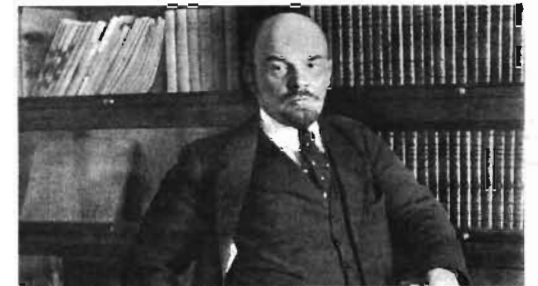
Владимир Ильич Ленин.