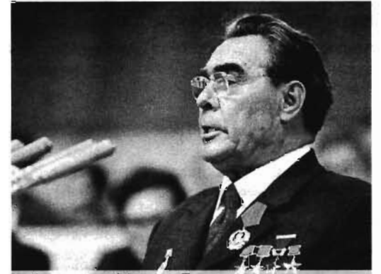
Леонид Ильич Брежнев.