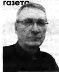
Страницу подготовил Владислав Плисенко.