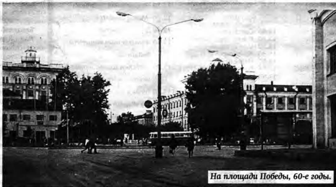
На площади Победы, 60-е годы.