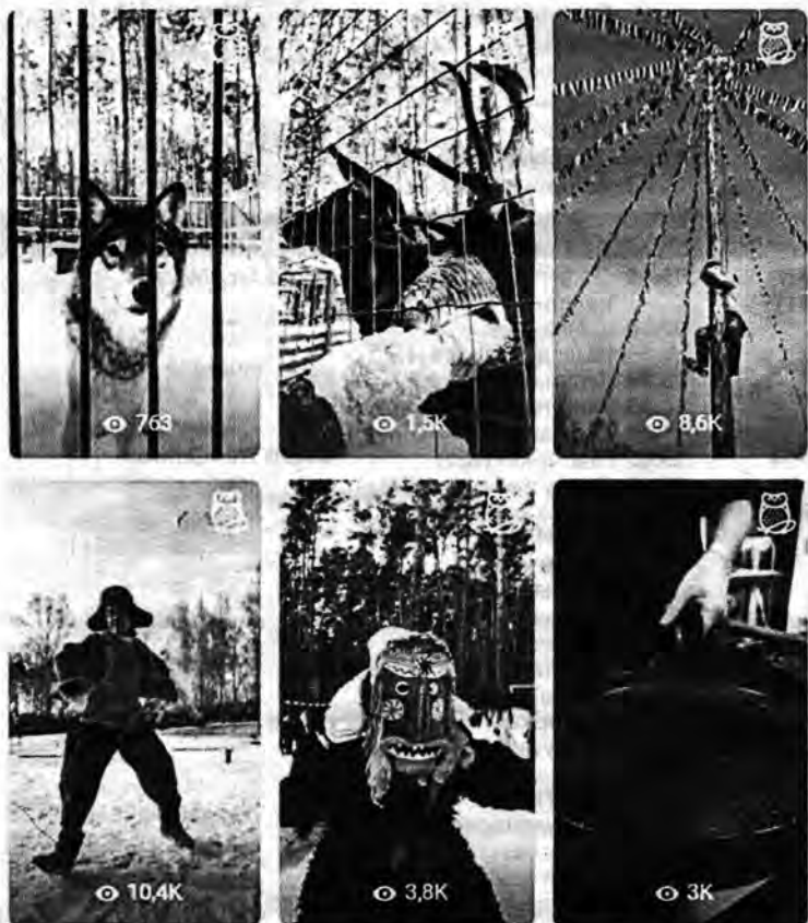
Музей-заповедник «Томская Писаница» > Клипы 240