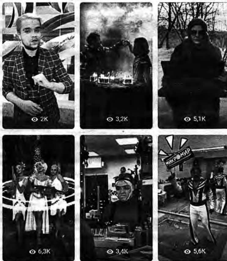
Музыкальный театр Кузбасса им. А. К. Боброва > Клипы 65

интересные и полезные новости о работе учреждений, ближайших и действующих выставках, поступлениях новых книг в библиотеки, афиши концертов и спектаклей.