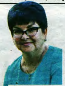
Страницу подготовила Наталья Артёмкина.

В год 80-летия Великой Победы впервые в истории прошёл турнир Ленинск-Кузнецкого муниципального округа по пауэрлифтингу (жиму лежа) памяти маршала артиллерии Г.Е. Передельского. Эти соревнования стали настоящим событием, причём не только для нашего округа. Они соединили в себе спорт и память о нашем выдающемся земляке, а также провели чёткую параллель между прошлым и настоящим, подтверждая то, что во все тяжёлые для нашего Отечества времена на его защиту встают стойкие и мужественные мужчины родом из всех городов и весей.