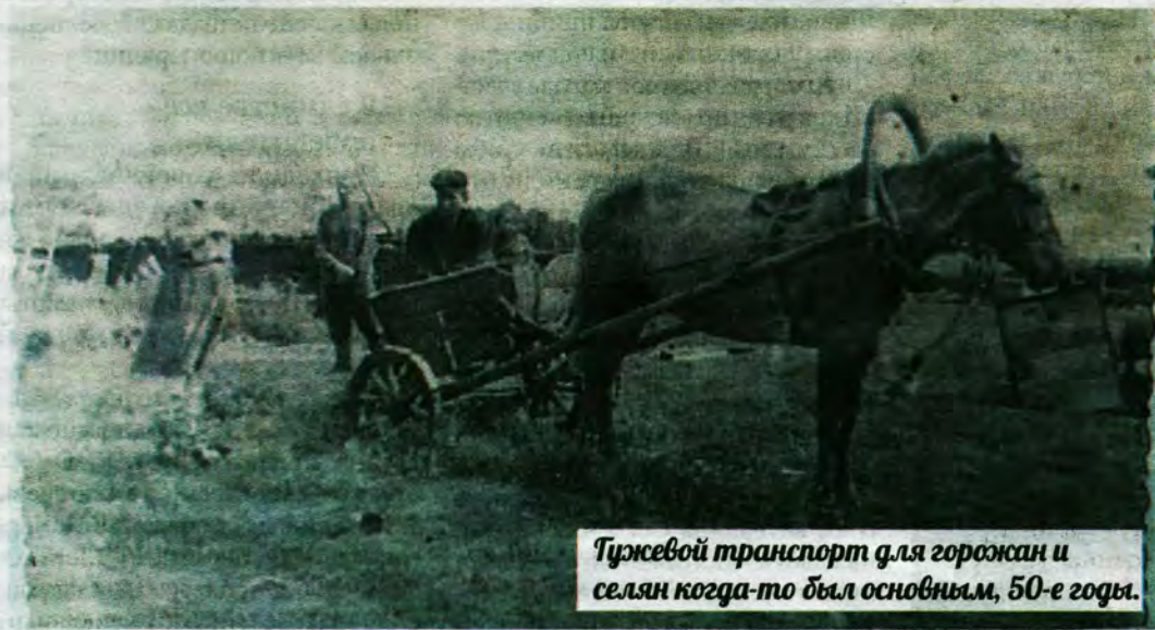
Трудовой транспорт для горожан и селян когда-то был основным, 50-е годы.