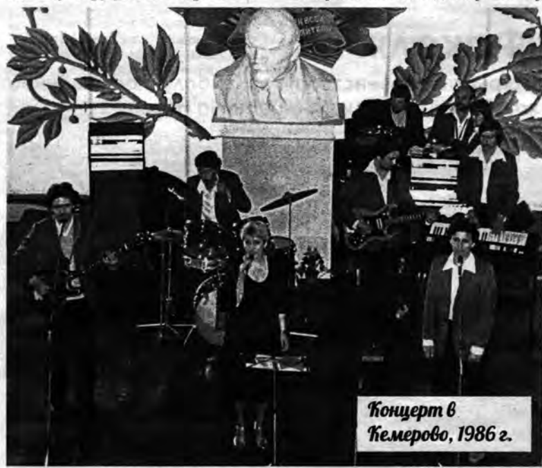
Концерт в Кемерово, 1986 г.