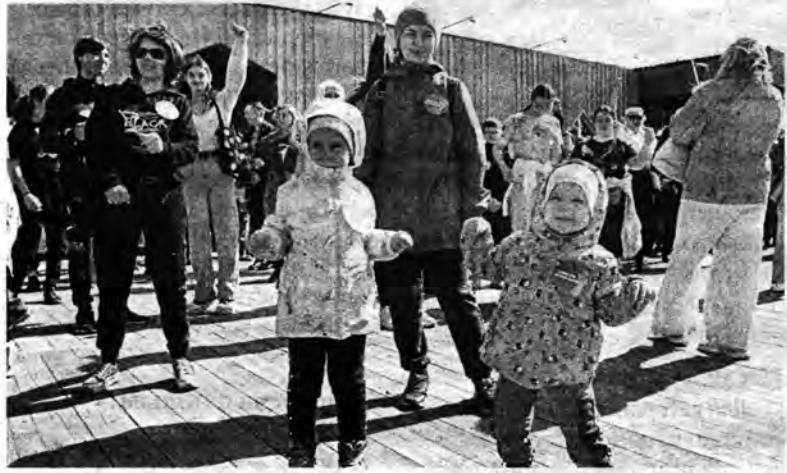
Больше фото в группе ВКонтакте.