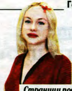
Страницу подготовила Татьяна Афаньева.