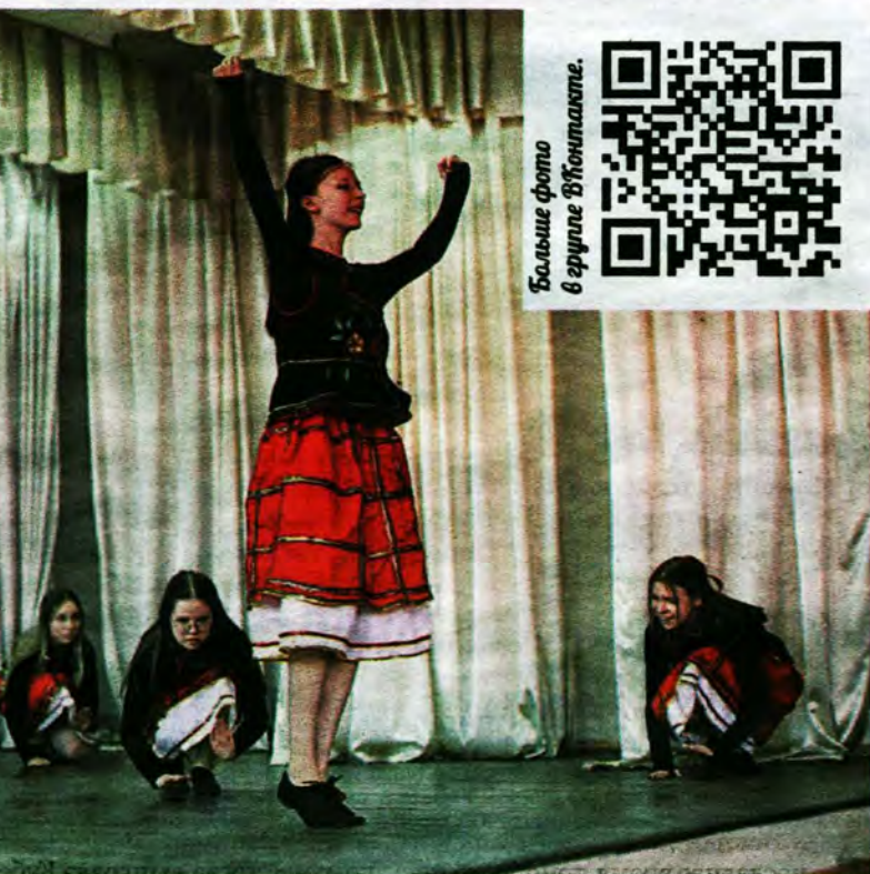
Больше фото в группе «ВКонтакте».