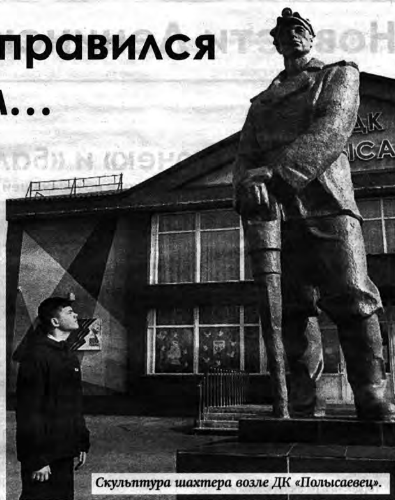
Скульптура шахтера возле ДК «Полысаевец».

По-настоящему близким и знакомым для Антона является музей Шахтёрской славы имени Ивана