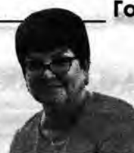
Страницу подготовила Наталья Артёмкина.

Город и люди делали всё возможное, чтобы приблизить час Победы. Мы, их потомки, встречаем 80-летие Победы с великой благодарностью и огромной гордостью за них. Как показывает выставка в музее, сегодня советы ветеранов города и сотрудники музея делают всё возможное, чтобы достойными мужественных и стойких защитников Родины выросли уже наши дети и внуки.