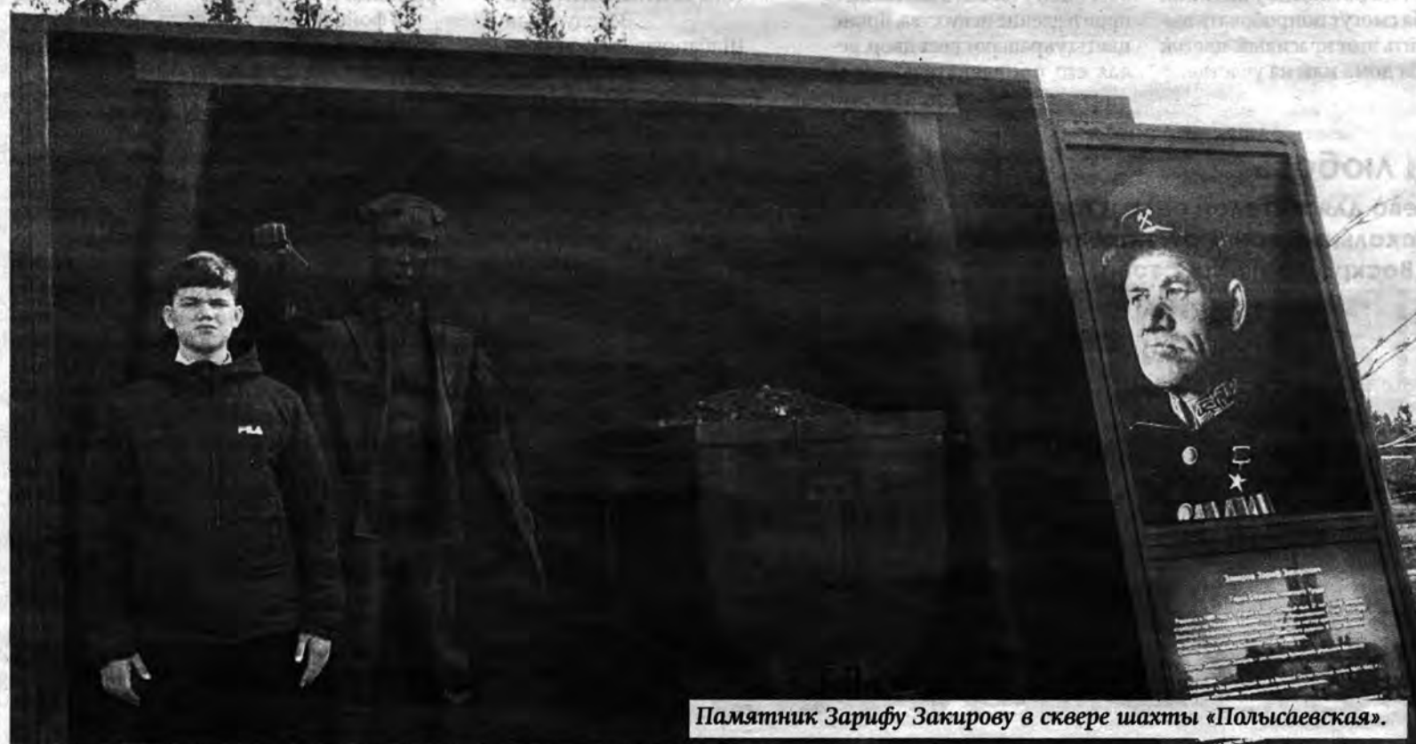
Памятник Зарифу Закирову в сквере шахты «Полысаевская».