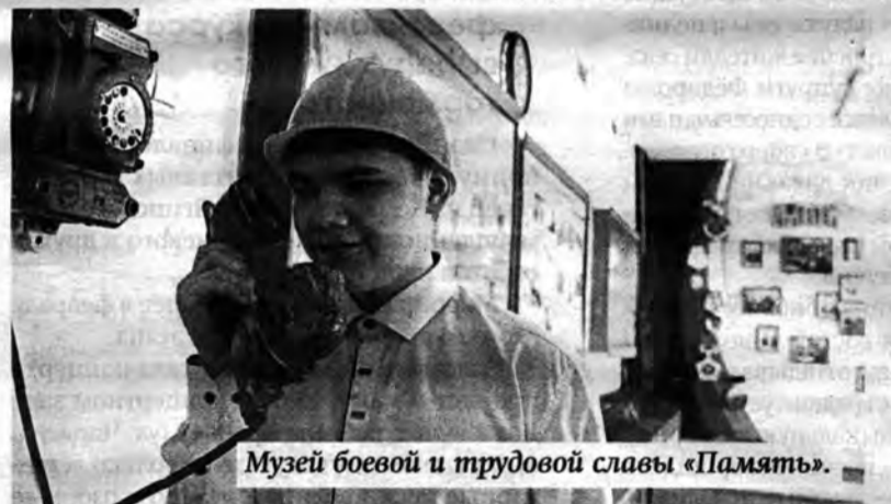
Музей боевой и трудовой славы «Память».