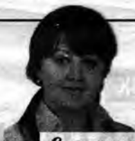
Страницу подготовила Марина (Левкович).

Уже на пороге, прощаясь, бриллиантовые юбиляры признались, что счастливы вместе: «И это не ради красного словца! Если бы нам представилась возможность заново выбирать свою судьбу, мы бы вновь выбрали друг друга».