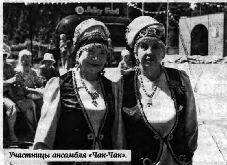
Участницы ансамбля «Чак-Чак».

Фото автора и из архива ДК «Полысаевец».