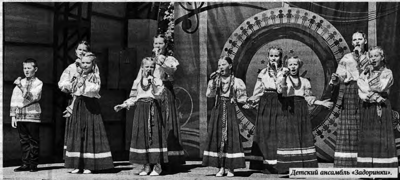
Детский ансамбль «Задоринки».

Для тех, кто заглянул в выходной день в парк имени Горьца, прозвучали песни на русском, татарском, немецком, казахском языках. Они были разными - грустными и веселохороводными, о любви и о родной стране... Звуки гармошки сливались со звонкими голосами и дарили душевное тепло гостям, некоторые из которых забрались на самый верх трибун, – вероятно, для того, чтобы видеть все как на ладони. А может, так и