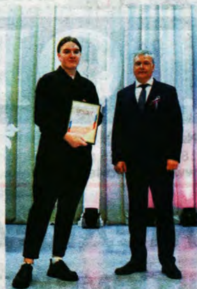
тем, кто посвятил свою жизнь спасению других людей.

Праздничное настроение в зале создавали музыкальные номера, подготовленные работниками культуры. Со сцены звучали не только песни в исполнении артистов Центрального дворца культуры, но и поздравления, потому как День медицинского работника - это не просто праздник, но еще и хороший повод для того, чтобы сказать спасибо