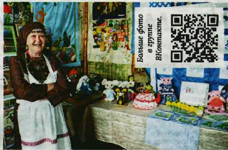
Больше фото в группе ВКонтакте.

Сегодня она в гости приехала не с пустыми руками - бижутерия, украшения для женщин, и все это она изготовила сама.