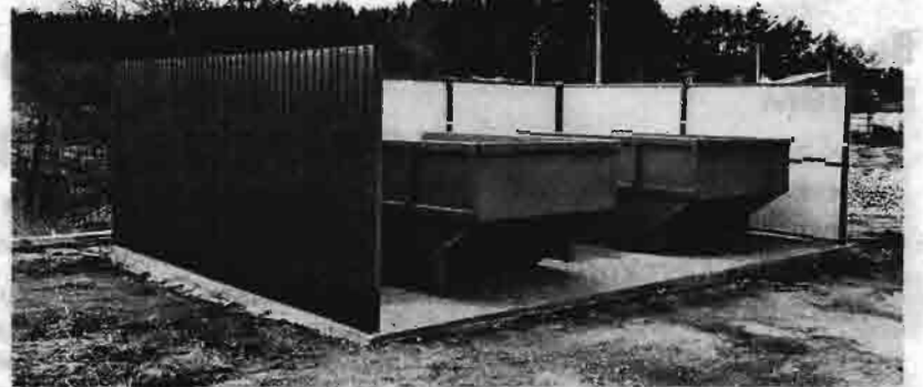
АДРЕСА НОВЫХ КОНТЕЙНЕРНЫХ ПЛОЩАДОК

Щедрин пер. - с 17-го дома, Павленко пер. - с 16-го дома, Природный пер. - вся улица, Декабристов пер. - вся улица, Победный пер. - вся улица, Плотный пер. - вся улица, Декабристов - вся улица, Павленко - вся улица, Рылеева - вся улица, Самаркандский пер. - с 16-го дома, Стартовый пер. - вся улица, Стекольный пер. - с 21-го дома, Плодородный пер. - вся улица, Тополиный пер. - вся улица, Тополиная - вся улица, Автомобилистов - вся улица, Автомобилистов пер. - вся улица, Сиреневый пер. - вся улица, Пестеля - вся улица, Пестеля пер. - вся улица, Клубный пер. - вся улица, Сочинский пер. - вся улица, Сухумский пер. - вся улица, Кисловодский пер. - вся улица, Кольцевой пер. - вся улица, Макарова - с 16-го дома, Невельского - с 10-го дома, Верещагина - вся улица, Кольцевая - с 14-го дома, Сурикова - нечетная сторона, Бутакова - вся улица, Тверская - до 26-го дома, Чаадаева - вся улица, Чаадаева пер. - вся улица, Валдайский пер. - вся улица, Чукотский пер. - вся улица, Надежная - с 139-го дома.