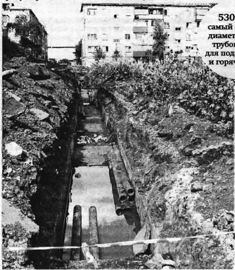
530 мм – самый большой диаметр нового трубопровода для подачи тепла и горячей воды.