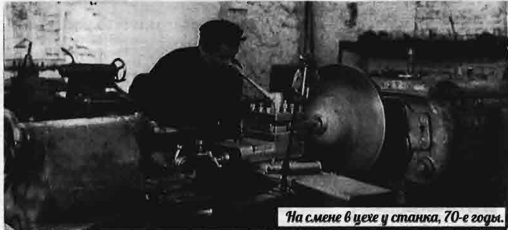
На смене в цехе у станка, 70-е годы.