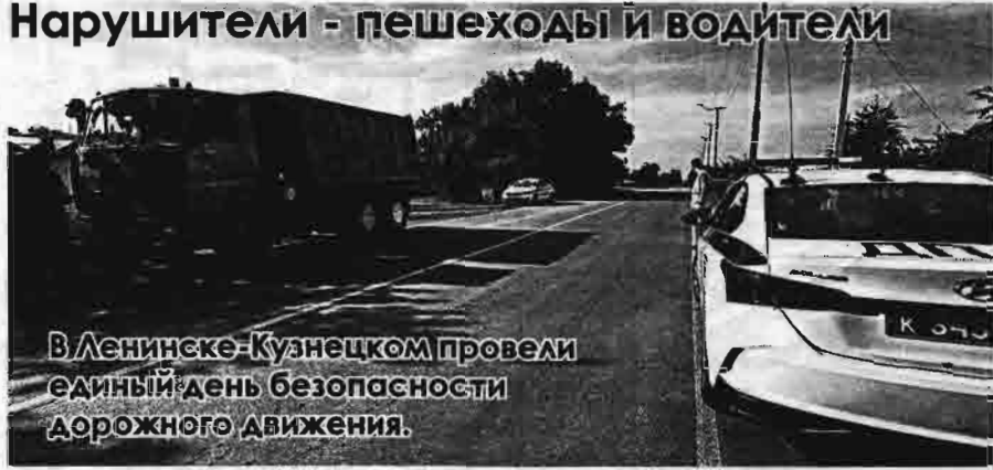
В Ленинске-Кузнецком провели единый день безопасности дорожного движения.

Наряды ДПС пресекли более 30 правонарушений, 8 из которых были на счету пешеходов. Трое водителей управляли транспортом в состоянии алкогольного опьянения, а двое передвигались на машинах с затемнёнными стеклами. Один не имел права управления, другой заплатит штраф