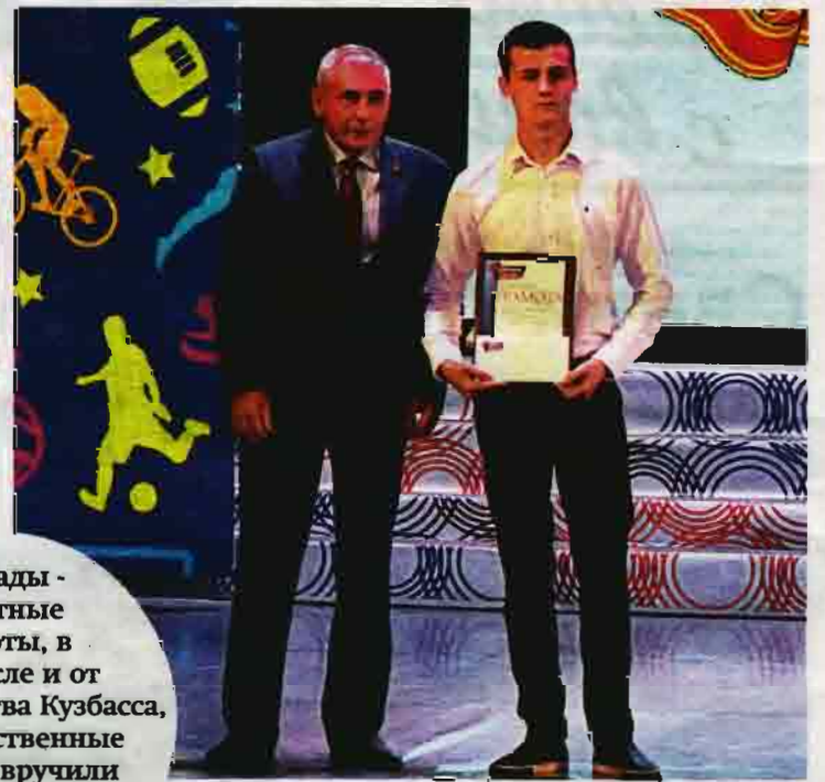
Награды - почетные грамоты, в том числе и от правительства Кузбасса, благодарственные письма - вручили 72-м виновникам торжества.

Почти треть населения нашего округа на профессиональном или любительском уровне занимается спортом. Физкультура постепенно шаг за шагом завоёвывает сердца школьников и студентов. Да и статистика говорит о том, что молодёжь всё чаще стала отдавать предпочтение физическим нагрузкам, а не бездумному «сидению» в гаджетах. «Спортсмены Ленинска-Кузнецкого, что во времена Советского Союза, что в современной России, прославляли и продолжают прославлять наш