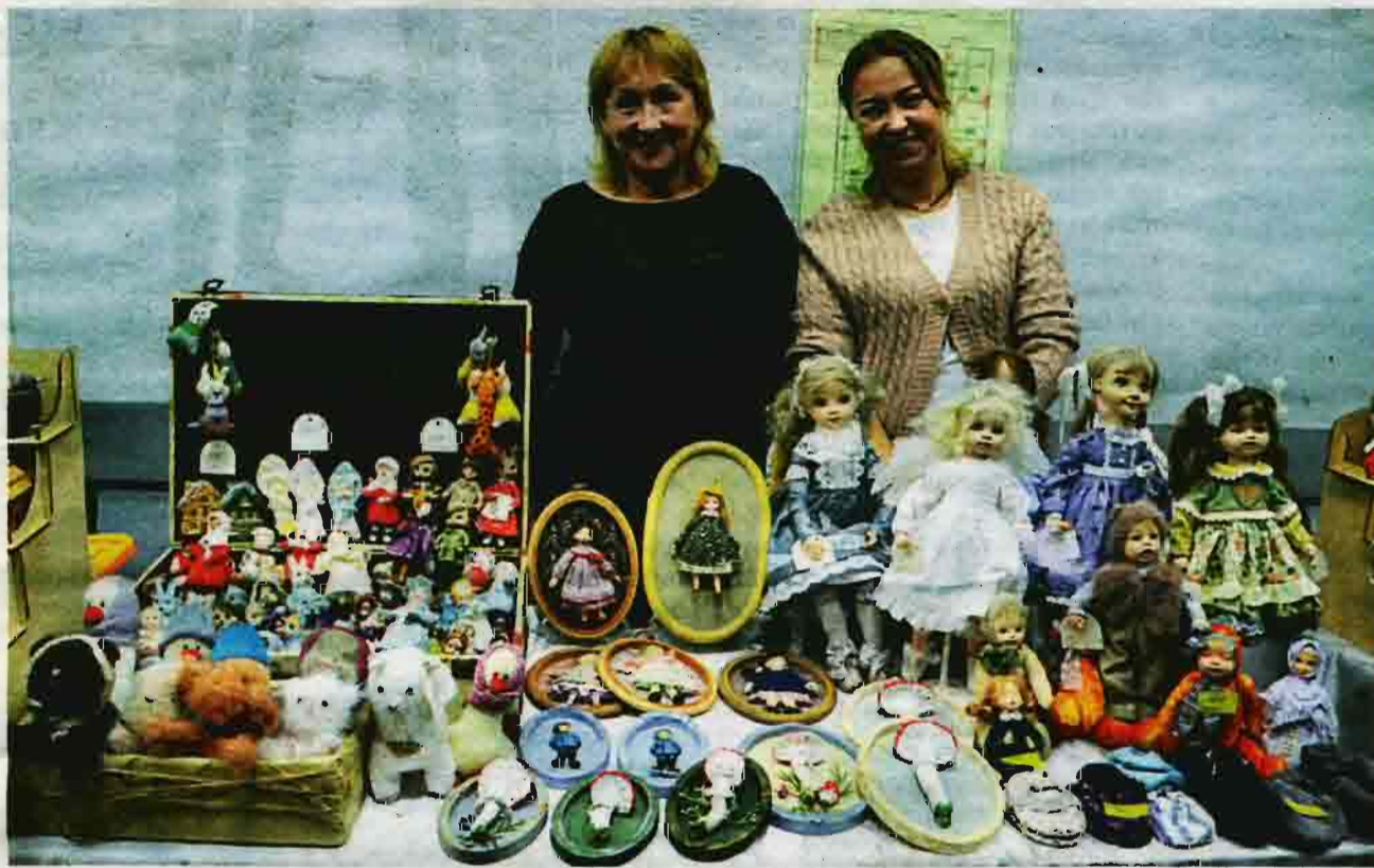
В Центре социального обслуживания населения г. Ленинск-Кузнецкий прошла ежегодная выставка-продажа изделий декоративно-прикладного творчества «Мини-Арбат - 2025».