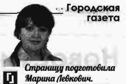
Страницу подготовила Марина Левкович.

На протяжении всего праздника на стадионе работали локация с играми на ловкость и смекалку, которые принесли с собой активисты «Движения Первых».