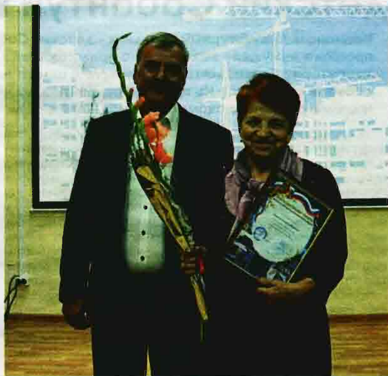
Страницу подготовила Марина Левкович.

Поздравление умудренных опытом, уважаемых людей началось с воспоминаний. Работники библиотеки создали уникальный короткометражный фильм об исторических фактах из жизни нашего округа. «По состоянию на 1 мая 1983 года в состав треста «Ленинскшахтострой» входили три генподрядных стройуправления - Байкаимское, Беловское №1 и Полысаевское. Численность трудящихся составляла около 2 тысяч человек. Через четыре года, в 1987-м, тресты «Ленинскпромстрой» и «Ленинскшахтострой» были объединены», - звучал голос с экрана. Статистика возведенных нашими строителями объектов поражает. Вот лишь малая часть из того, что в своё время было построено: 15 угольных предприятий, 7 дошкольных детских учреждений и столько же магазинов, 5 столовых, здание политехнического техникума, комбинат