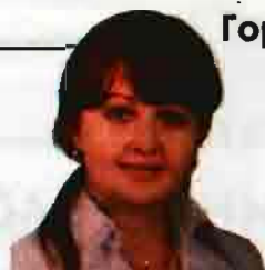
Страницу подготовила Марина Левкович.