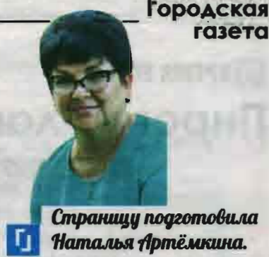
Страницу подготовила Наталья Артёмкина.

Как нельзя более подходящий день выбрали в Центре социального обслуживания населения для проведения осенней ярмарки и благотворительной акции «Стол добра». Замечательную идею пригласить ветеранов с плодами их летнего труда, чтобы они смогли поделиться излишками своего урожая с другими, в ЦСОН реализовали впервые. Но «первый блин» получился совсем «не комом».