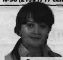
Страницу подготовила Марина Левкович.