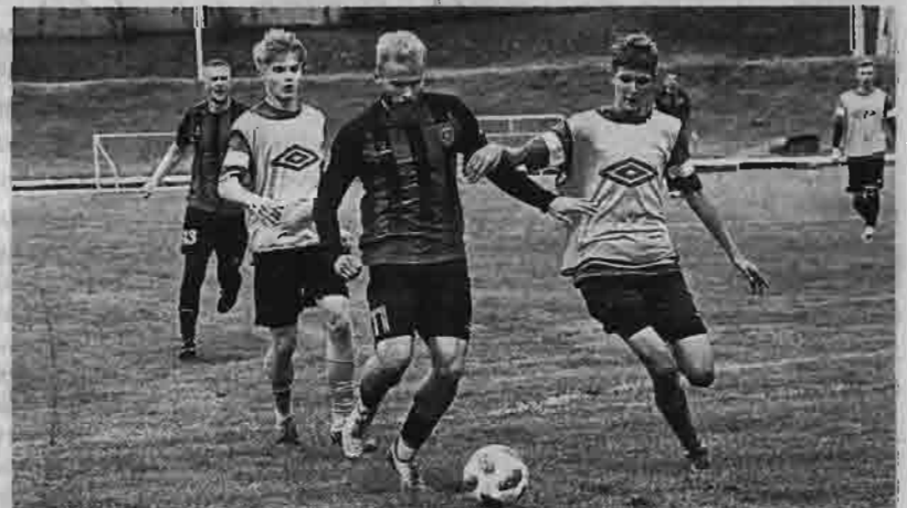
Положение команд после 14-го тура