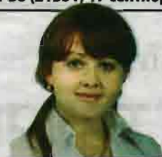
Страницу подготовила Марина Левкович.

На базе детского сада №51 прошел традиционный туристический слет дошколят, посвященный Году защитника Отечества и Всемирному дню туризма. В путешествие по тематическим станциям отправились 60 маленьких участников из 12 ленинск-кузнецких детсадов. Преодолеть нужно было многое: малыши то складывали костры, то собирали в поход вещмешок, то вместе с «партизанами» пробирались сквозь «паутинку».