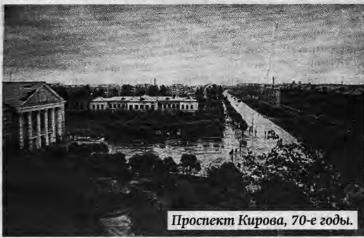
Проспект Кирова, 70-е годы.

ещё немало лет. Когда на улице Пушкина возвели новое типовое строение, старое приспособили под восьмилетнюю школу №46. А когда в 1976 году её закрыли, в этом здании разместился учебно-производственный комбинат (сокращённо УПК). Думаю, многие вспомнят школьные годы, когда, помимо обычных уроков, приходилось ещё ездить на занятия к нам в УПК. Там я проработал несколько лет (с 2000 по 2004) до самого его закрытия, и у меня остались с той далёкой теперь уже поры самые светлые воспоминания.