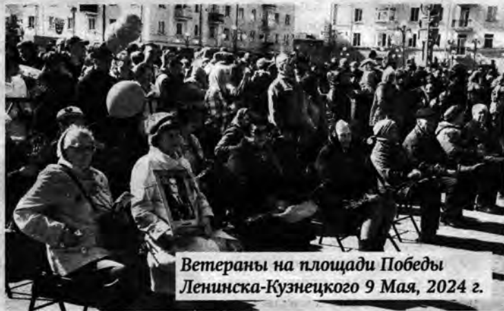
Ветераны на площади Победы Ленинска-Кузнецкого 9 Мая, 2024 г.

В январе принимают поздравления с юбилеями долгожители Ленинска-Кузнецкого, Польшаево и поселений района, родившиеся в далёкие предвоенные десятилетия. Всего 16 ветеранов муниципального округа переступают сейчас порог 90-летия, ещё пятеро встречают день рождения в 95-й раз, и у нас есть даже столетняя долгожительница.