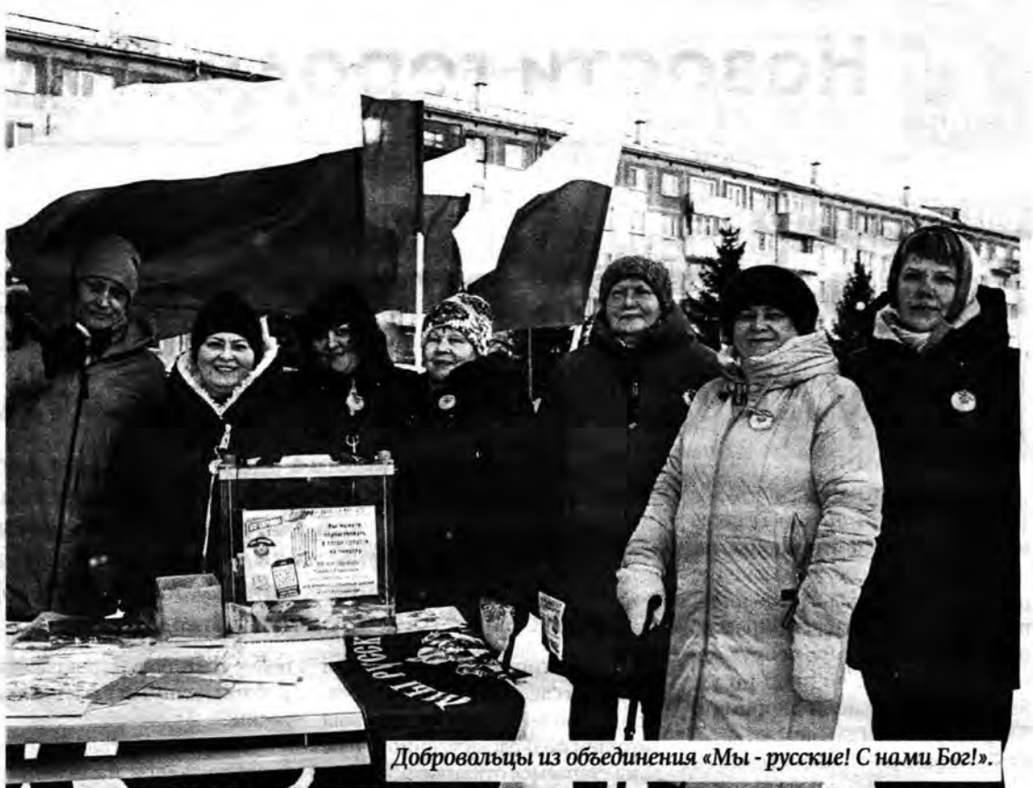
Добровольцы из объединения «Мы - русские! С нами Бог!».