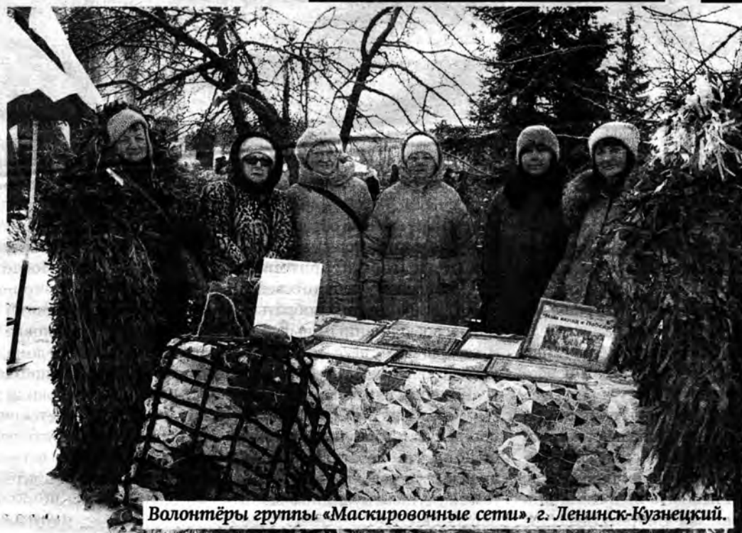
Волонтеры группы «Маскировочные сети», г. Ленинск-Кузнецкий.

округа. «Мы - русские! С нами Бог!», «Маскировочные сети», «Помощь СВО от жителей пос. Демьяновка», «Супы и каши для Победы», «Добрые люди - добрые дела», «Вместе к Победе!»... Сплотившиеся вокруг них жители Ленинска-Кузнецкого, Польсаева и района - это пример тихого гражданского подвига, который они ежедневно совершают во имя всех наших земляков. Третий год подряд эти неравнодушные люди собирают и отправляют на фронт тысячи тонн гуманитарных грузов, плетут, шьют и вяжут, готовят, пакует и фасуют, продолжая традиции своих матерей, бабушек и прабабушек, которые более 80 лет назад трудились не покладая рук в глубоком тылу во имя Победы.