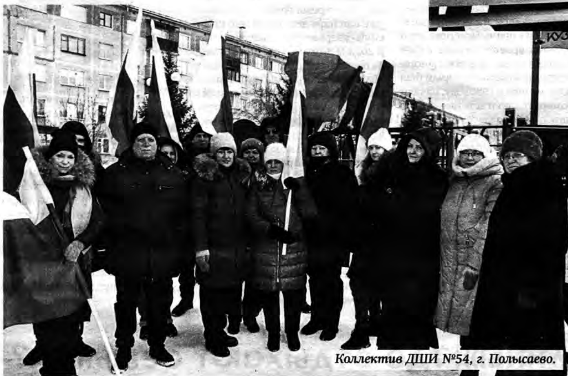
Коллектив ДШИ №54, г. Польшаево.