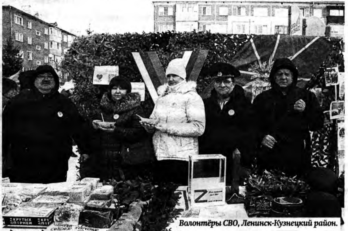
Волонтеры СВО, Ленинск-Кузнецкий район.