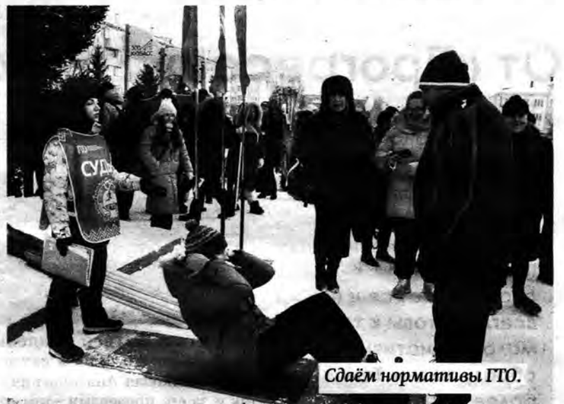
Сдаём нормативы ГТО.