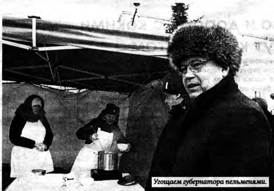
Угощаем губернатора пельменями.