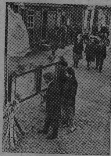
Кустанайская область. Комсомольско-молодежная бригада № 3 из колхоза имени Шевченко — одна из лучших в Тарановском районе. За высокие темпы уборки урожая и хорошую организацию труда бригада награждена переходящим Красным знаменем райкома партии и райисполкома.

В бригаде 3600 гектаров посевов пшеницы. Весь хлеб с этой площади обмолочен. В среднем с каждого гектара здесь получили по 20—22 центнера зерна.