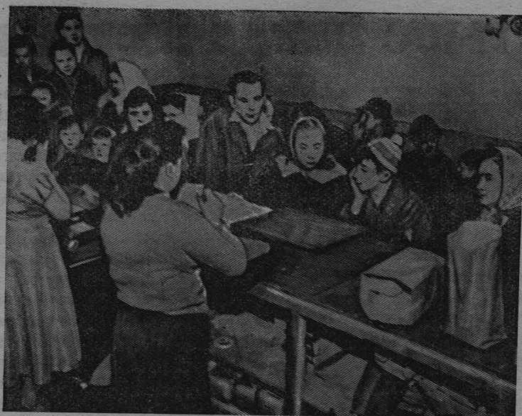
К экономическому положению в Соединенных Штатах Америки. Штат Мэн, Биддефорд. Очередь нуждающихся на пункте, где выдают продукты.

Сложена даже поговорка: «Если хочешь есть фугу, напиши сначала завещание».