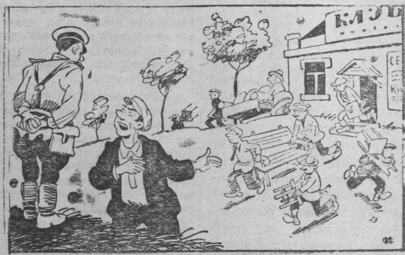
— Чего смотреть?! Клуб растаскивают! — Да нет. Сеанс кончился, свою мебель обратно по домам расносят. Рис. И. Сычева.