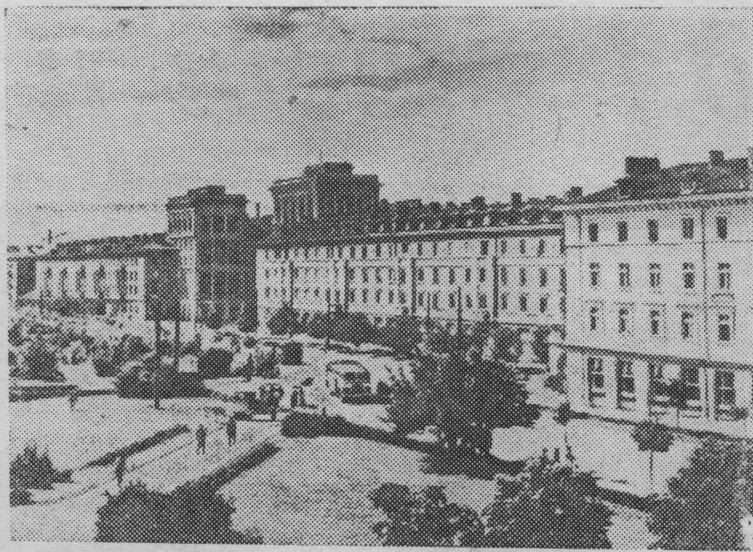
Народная Республика Болгария. Кварталы жилых домов в Димитровграде.

Советское правительство выражает признательность правительству Канады за выраженное им намерение пригласить Председателя Совета Министров СССР с официальным визитом в Канаду».