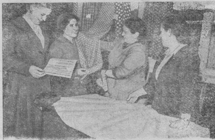
Челябинск. Дворец культуры Челябинского тракторного завода регулярно проводит вечера отдыха для рабочих, борющихся за звание бригад и ударников коммунистического труда.

Дело Ленина живет, оно действительно проникает за пределы партии, которую он создал и которой он руководил, в безвестные широчайшие массы, которые трудятся в Советском Союзе над социалистическим строительством, которые ведут в капиталистических странах освободительную борьбу за власть, которые поднимаются в колониальных странах против своих господ — эксплуататоров и угнетателей. То историческое, творческое дело, которое они осуществляют, будет ему достойным памятником.