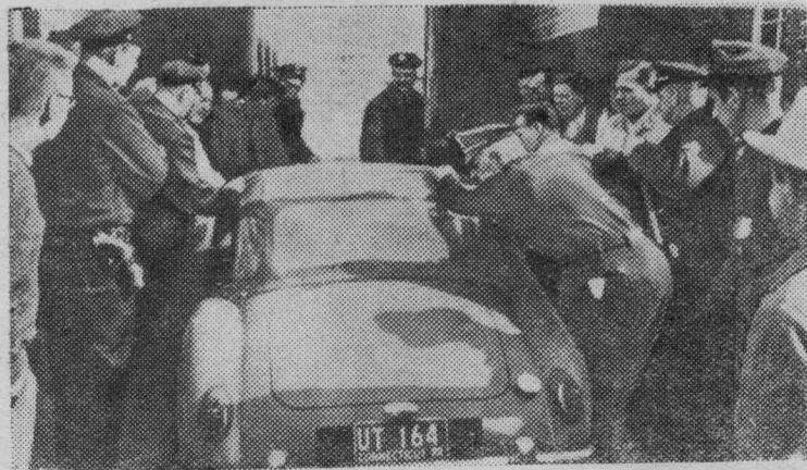
Соединенные Штаты Америки. Забастовка рабочих завода компании «Зингер» в городе Бриджпорте. Забастовщики выставили пикет у ворот завода.

На снимке: полицейские проталкивают машину служащего компании через пикет.