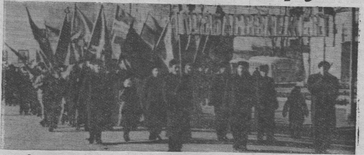
О перевыполнении 10-месячного плана на праздничной демонстрации рапортовали трудящиеся завода «Кузбассэлемент».

Будущих шахтеров сменяют на площади сами шахтеры. Идет коллектив шахты имени С. М. Кирова. Более восьмидесяти тысяч тонн сверхпланового топлива выдали ее труженики в честь 43-й годовщины Октяб-