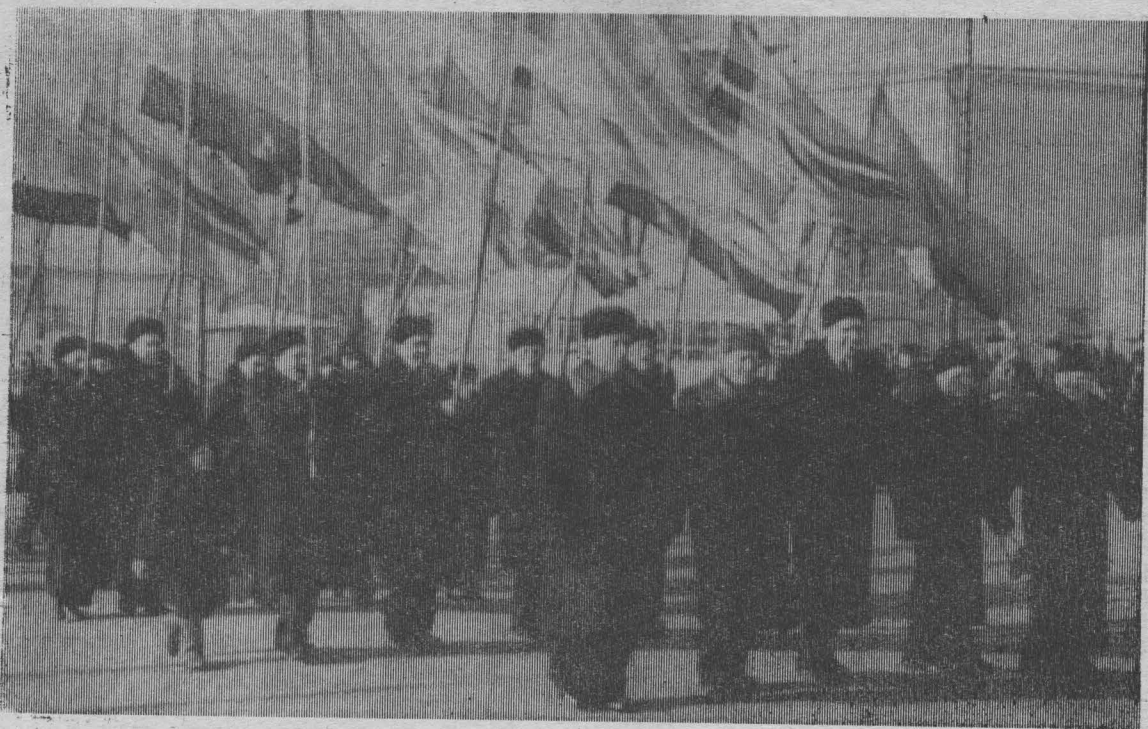
С чувством выполненного долга вышли на демонстрацию кировцы. В подарок Родине они выдали 11 тысяч тонн сверхпланового угля.