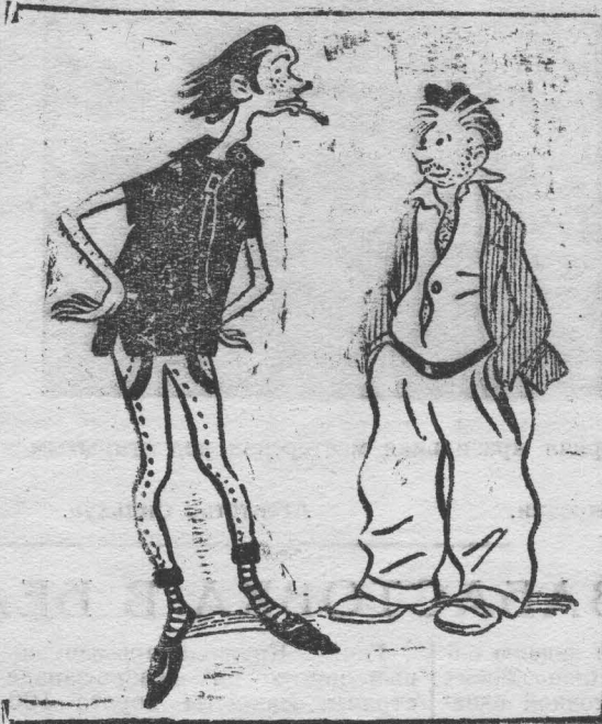
Оба сапога — пара. Рис. А. Цветкова.

КУЗНЕЦОВА, ЕДАКИНА, работницы 2-го района, шахты «Журилка-3».