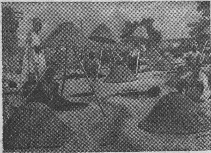
Нигерия. Кустарная красильная мастерская под открытым небом.