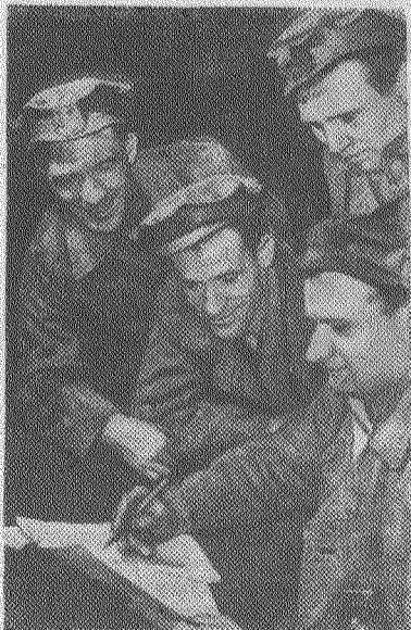
Луганская область. На 3-м участке шахты № 12-12 бис треста «Краснолучуголь» осваивается новый комплекс оборудования для механизированной добычи угля. Горняки участка стремятся максимально использовать новую технику. Соревнуясь в честь XXII съезда КПСС, они достигли вы-