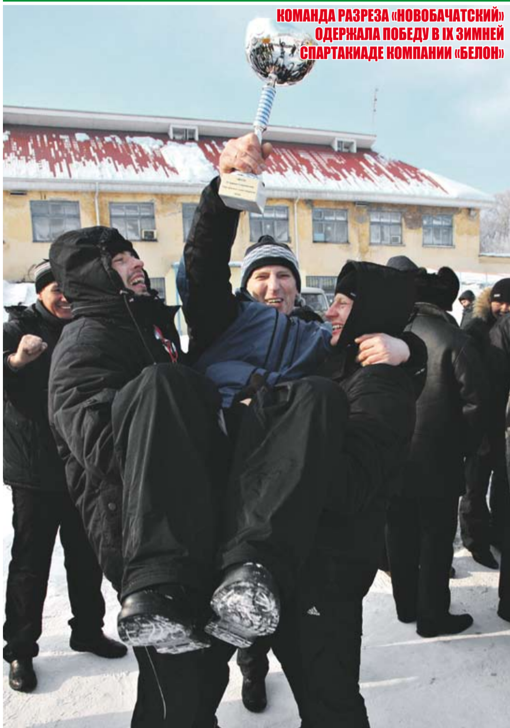
КОМАНДА РАЗРЕЗА «НОВОБАЧАТСКИЙ» ОДЕРЖАЛА ПОБЕДУ В IX ЗИМНЕЙ СПАРТАКИАДЕ КОМПАНИИ «БЕЛОН»

ИЗДАНИЕ ОАО «БЕЛОН» (ГРУППА ПРЕДПРИЯТИЙ ММК)