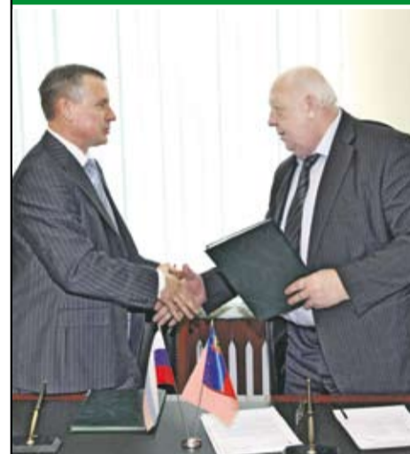
ОАО «БЕЛОН»: ГОСУДАРСТВЕННЫЙ ПОДХОД В ВЕДЕНИИ БИЗНЕСА