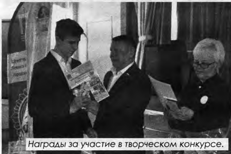
Награды за участие в творческом конкурсе.

Тем временем по всему пространству спортзала свою физическую подготовку демонстрировали старшеклассники и пары, состоявшие из папы и сына. Двадцать юношей из разных городских школ, гимназий и лицей, а также одиннадцать пар отцов и детей принимали участие в тестовой сдаче нормативов ГТО (отжимание, подтягивание, прыжки в длину и др.). Настроение у всех было замечательным. С заданиями справлялись в меру своих возможностей, но накал спортивной борьбы