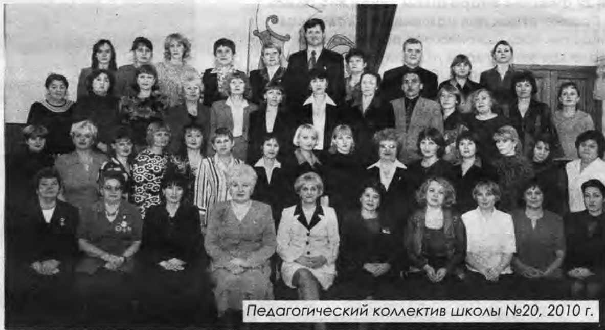
Педагогический коллектив школы №20, 2010 г.

«Перестройка изменила нашу жизнь. Было тяжело. Те, кто знал меня, пытались помочь, но предлагали такую работу, где я себя не видела. Мне важно было понимать, что мой труд будет нужен людям, и поэтому я искала. Работала некоторое время воспитателем в школе №6. После того как я ушла, детки прихо-