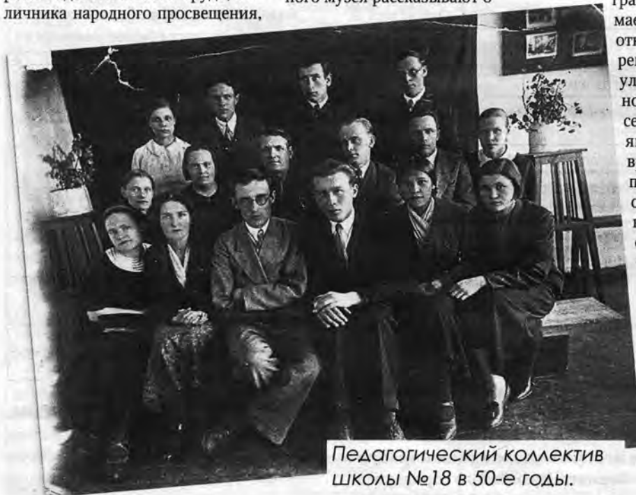
Педагогический коллектив школы №18 в 50-е годы.