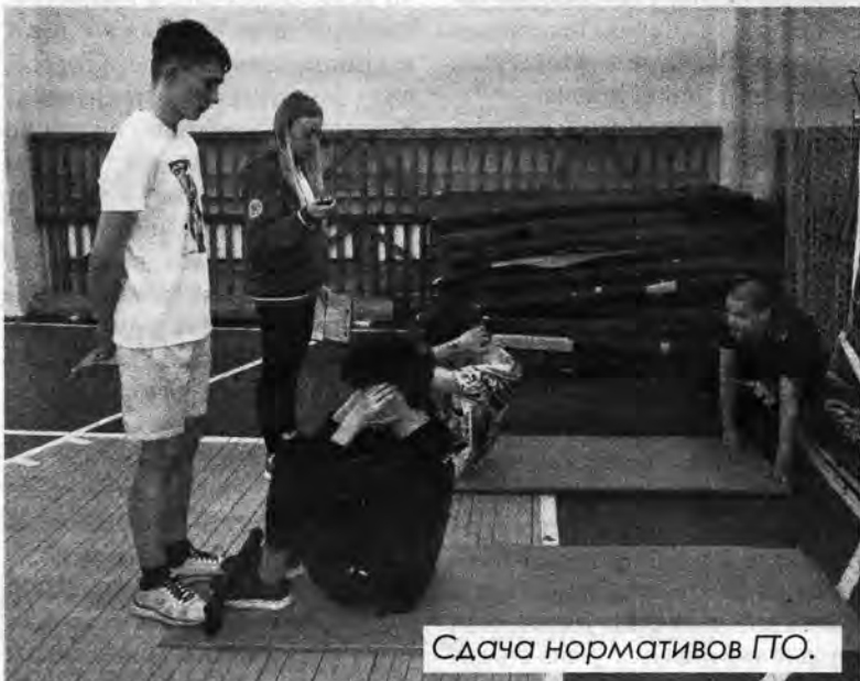
Сдача нормативов ГТО.