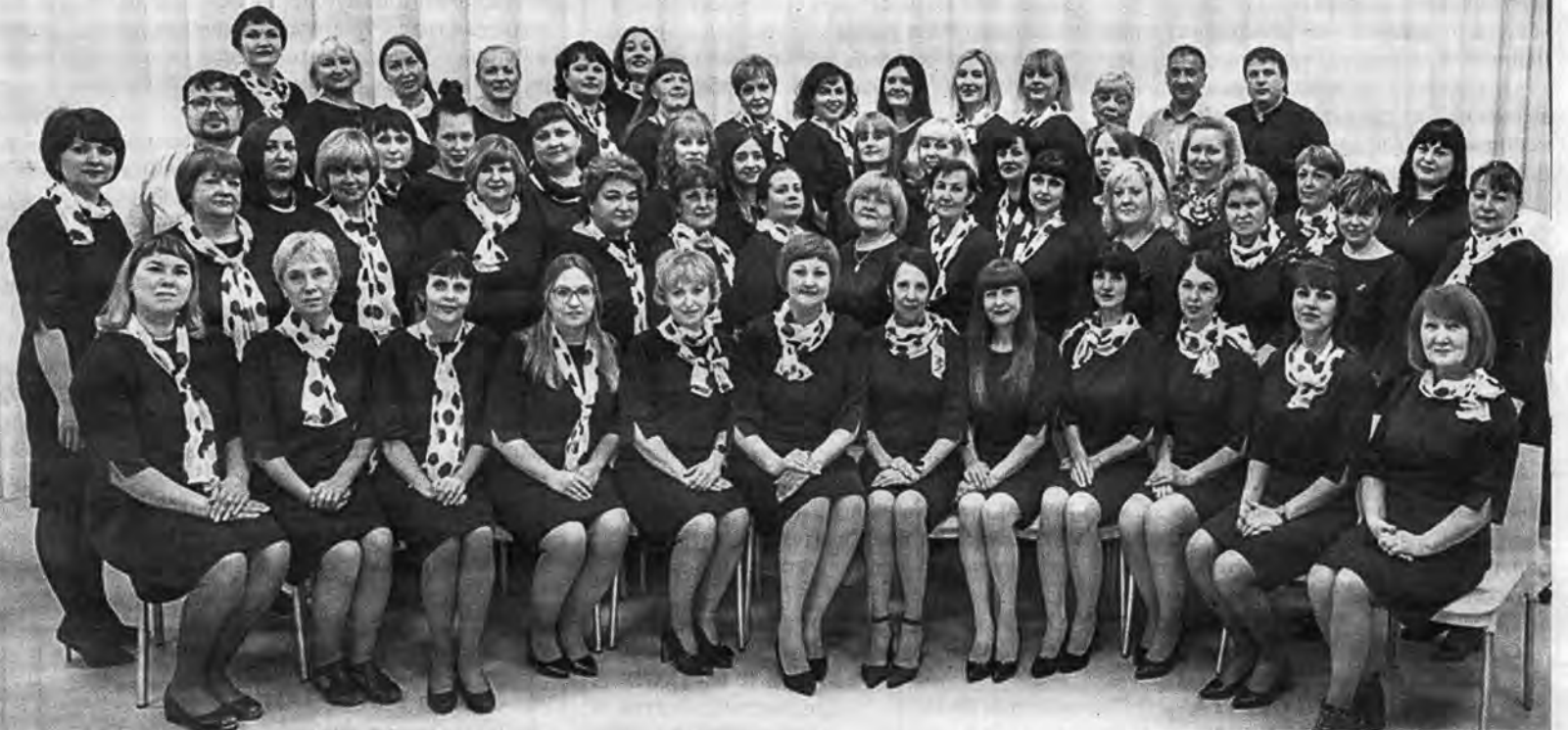
Педагоги гимназии №18 в наши дни.

2024-й год - юбилейный для гимназии №18: мы отмечаем 90-летие с начала деятельности в качестве средней школы. За эти годы пройден большой творческий путь. Путь взлётов, открытий, побед и педагогических свершений.