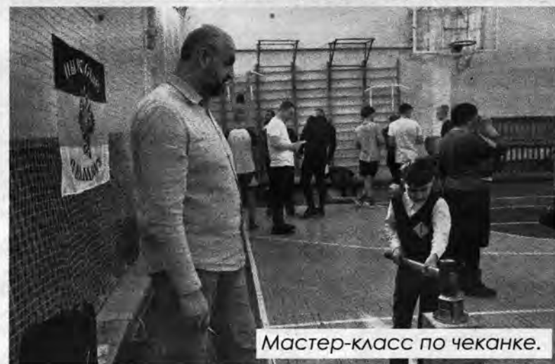
Мастер-класс по чеканке.