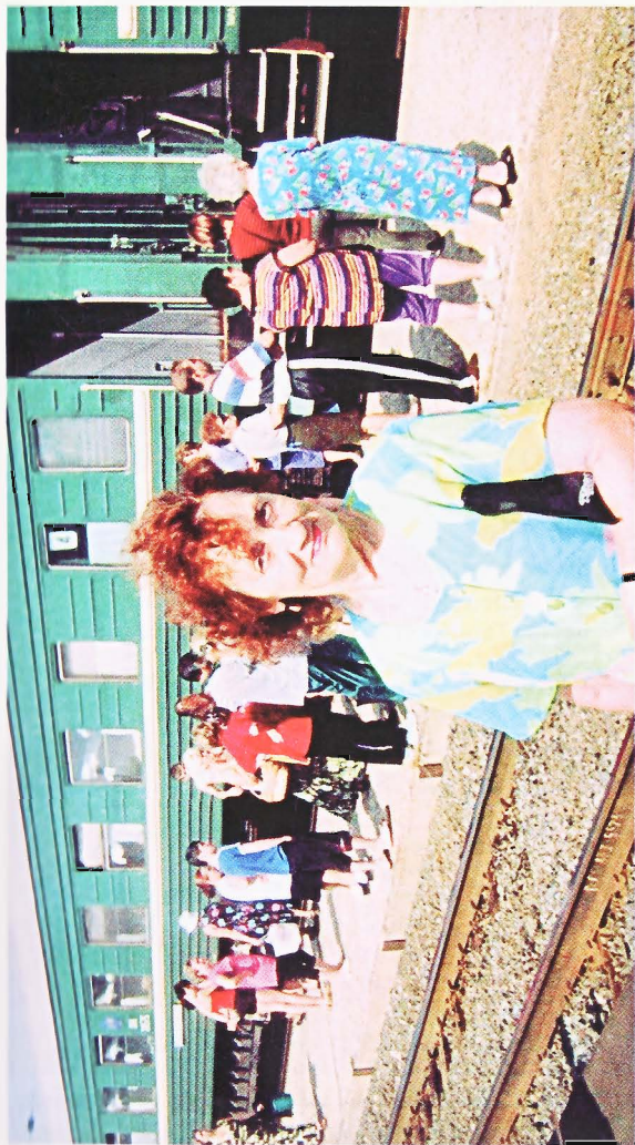
На Москву. Лето 2004 г.