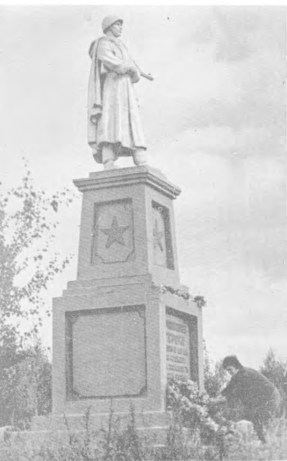
Памятник на ключевой Гнездиловской высоте героям, павшим в боях за Родину