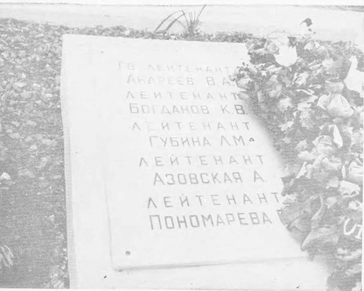
Богданов К. В... На братском кладбище в городе Ельне встретилось нам имя одного из героев боев за Великие Луки