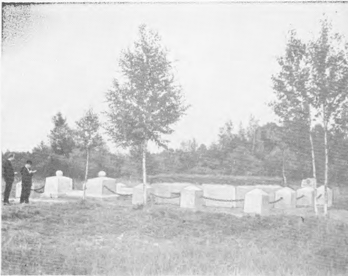
На месте подвига Александра Матросова колхозные умельцы соорудили дзот- памятник