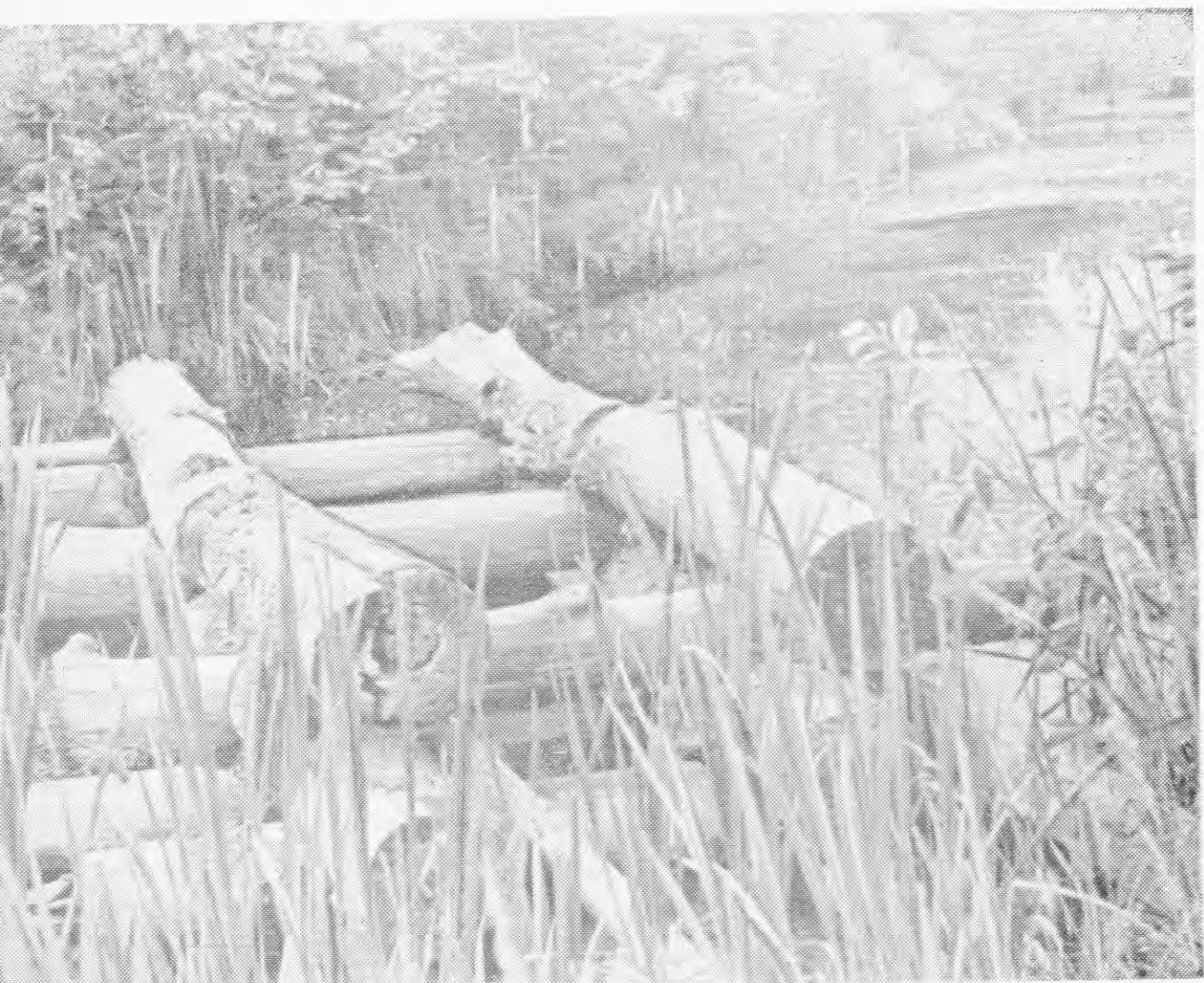
Такие гати настилали сибиряки на под- ступах к Белому