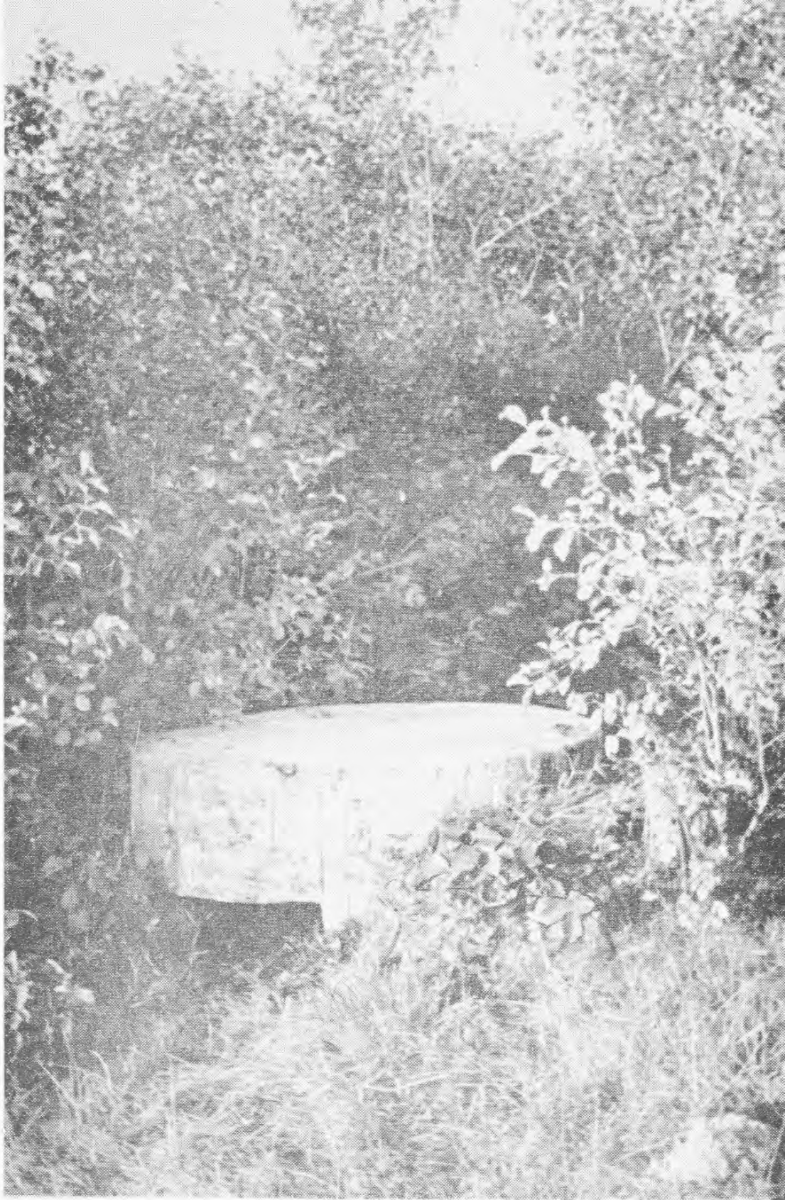
На развилке дорог застрял железобетон- ный дот...