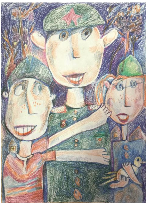
«Возвращение домой» Тузлав Илья Сергеевич, 9 лет