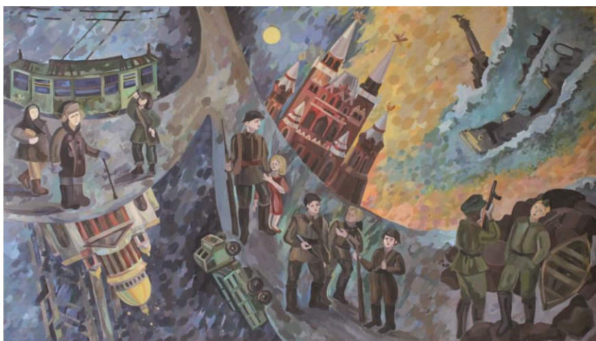
«Город Герой» Салтымакова Софья, 14 лет